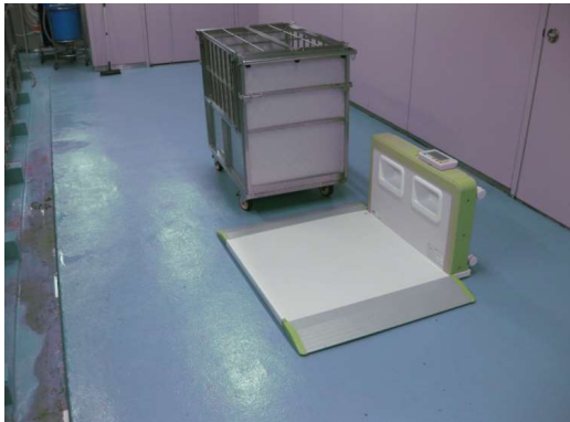
【測定ケージ 積載前】